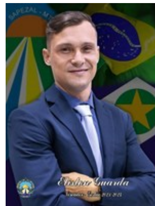
Eliston Guarda Partido Político PL